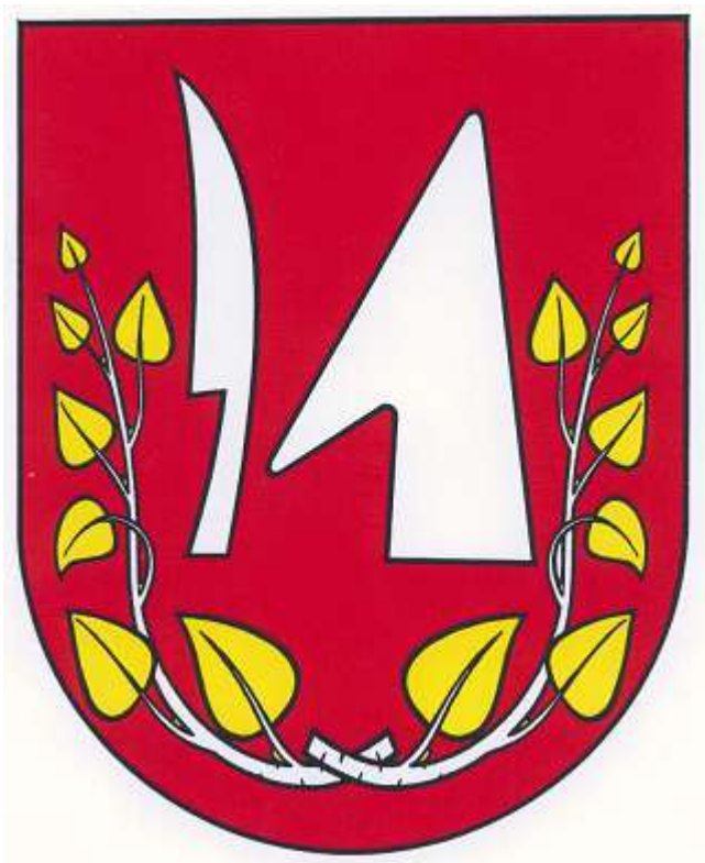
Vlajka obce :